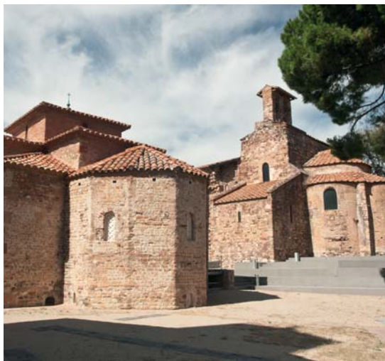
Absis de les esglésies de Sant Miquel i Sant Pere

In the extraordinary natural setting of Vallparadís Park, just 30 minutes from Barcelona, the La Seu d'Ègara monument site is a treasure trove of stunningly beautiful art treasure, with murals dating from the 5th to 8th centuries. This unique site has been presented as a candidate for UNESCO World Heritage Site status.