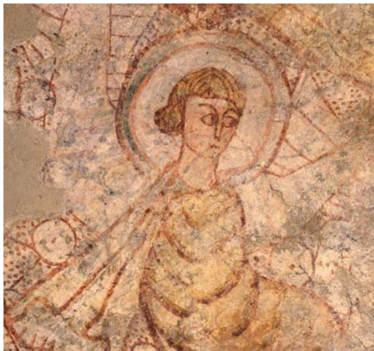
Pintura mural s. V-VIII

Al mig d'un entorn natural extraordinari, com és el Parc de Vallparadís, i a 30 minuts de Barcelona, el conjunt monumental de la Seu d'Ègara amaga un tresor de gran bellesa artística amb pintures murals dels segles V al VIII. Aquesta singularitat ha portat a presentar la candidatura per obtenir la distinció de Patrimoni de la Humanitat de la UNESCO.