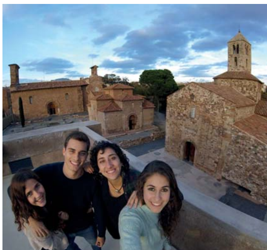
Vista de les tres esglésies que formen el conjunt

En medio de un entorno natural extraordinario, como es el Parque de Vallparadís, y a 30 minutos de Barcelona, el conjunto monumental de la Seu d'Ègara esconde un tesoro de gran belleza artística con pinturas murales de los siglos V al VIII. Esta singularidad ha llevado a presentar la candidatura para obtener la distinción de Patrimonio de la Humanidad de la UNESCO.