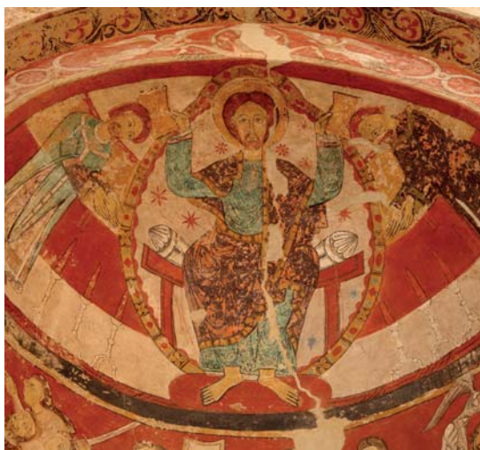
Martiri de Sant Tomàs Becket. Pintura mural s. XII-XIII

Au cœur d'un cadre naturel exceptionnel, le parc de Vallparadís, et à seulement 30 minutes de Barcelone, l'ensemble monumental de la Seu d'Ègara abrite un trésor artistique de toute beauté, des peintures murales datées du Ve au VIIIe siècle. En raison du caractère unique de ce site, une candidature à l'inscription au patrimoine de l'humanité de l'UNESCO a été présentée.