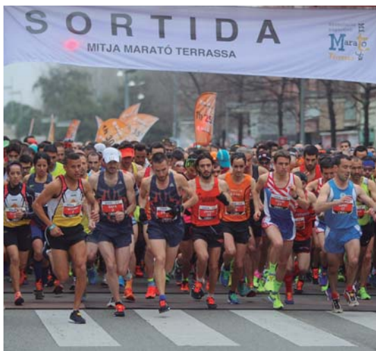
Sortida de la Mitja Marató de Terrassa

À Terrassa, vous trouverez le magnifique paysage du Parc naturel de Sant Llorenç del Munt i l'Obac . En son point culminant, le sommet de la Mola (1.104 m), se dresse un monastère d'origine romane. Cet espace naturel offre des itinéraires balisés pour tous types de public avec différents niveaux de difficulté. Si vous aimez les courses de montagne, sachez que la Vallès Drac Race vous fera revivre la légende du dragon de Sant Llorenç del Munt tout en parcourant ses différents chemins. Au cœur de la ville, le Parc de Vallparadís constitue un itinéraire de culture, de nature et de loisirs qui s'étend sur une distance de 3,5 km.