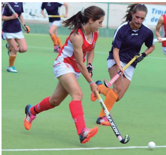
Competició d'equips femenins d'hoquei

Terrassa boasts an exceptional landscape in the Sant Llorenç del Munt i l'Obac Natural Park . Its highest point is the summit of La Mola (1,104 m), on which a monastery of Romanesque origin stands. This natural area has a number of sign-posted trails, suitable for all ages and levels. And, if you enjoy mountain racing, then the Vallès Drac Race is a chance to relive the legend of the dragon of Sant Llorenç del Munt along the mountain's different paths. In the middle of town is the Vallparadís Park , with a 3.5 km route mixing culture, nature and leisure.