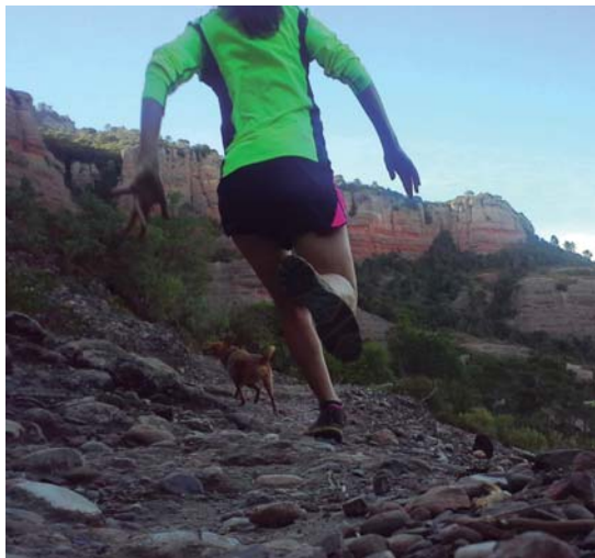
Esport al Parc Natural de Sant Llorenç i l'Obac

A Terrassa es troba l'excepcional paisatge del Parc Natural de Sant Llorenç del Munt i l'Obac . El punt més alt és el cim de la Mola (1.104 m), on hi ha un monestir d'origen romànic. En aquest espai natural trobaràs rutes senyalitzades per a tot tipus de públic i amb diferents graus de dificultat. I, si t'agraden les curses de muntanya, la Vallès Drac Race et permet reviure la llegenda del drac de Sant Llorenç del Munt tot recorrent-ne diferents camins. Al mig de la ciutat es troba el Parc de Vallparadís , un itinerari de cultura, natura i oci al llarg de 3,5 quilòmetres.