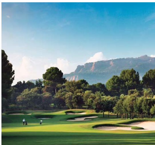
Reial Club de Golf El Prat

Terrassa cuenta con el excepcional paisaje del Parque Natural de Sant Llorenç del Munt i l'Obac . Su punto más alto es la cumbre de la Mola (1.104 m), donde se ubica un monasterio de origen románico. En este espacio natural encontrarás rutas señalizadas para todos los públicos y con diferentes grados de dificultad. Y, si te gustan las carreras de montaña, la Vallès Drac Race te permite revivir la leyenda del dragón de Sant Llorenç del Munt recorriendo sus diferentes caminos. En medio de la ciudad se encuentra el Parque de Vallparadís , un itinerario de cultura, naturaleza y ocio a lo largo de 3,5 kilómetros.