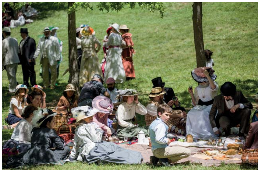
Fira Modernista: Festa local d'Interès Turístic de Catalunya

I en finalitzar les rutes, QUEDA'T A DINAR! i descobreix Terrassa Gastronòmica! Consulta en el següent enllaç: www.visitaterrassa.cat/restauracio